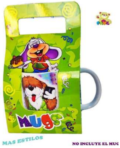
SE CAJA PARA MUGS 1.500 C.U