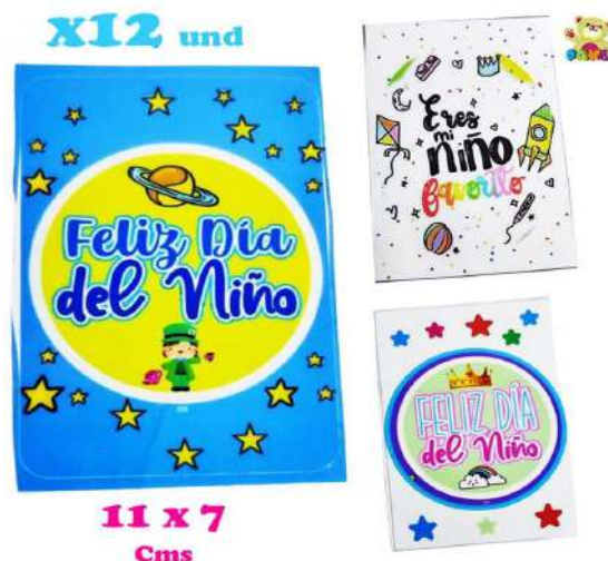
STICK-RTM STICKERS INFANTIL $10.200