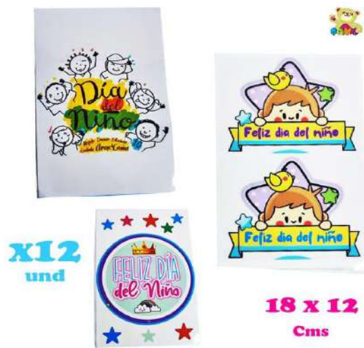
STICK-RTG STICKER INFANTIL GRDE $ 19.900