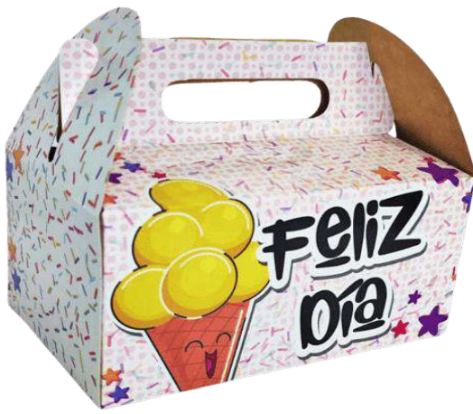
DS-CL100 $2.700 MAS MOTIVOS