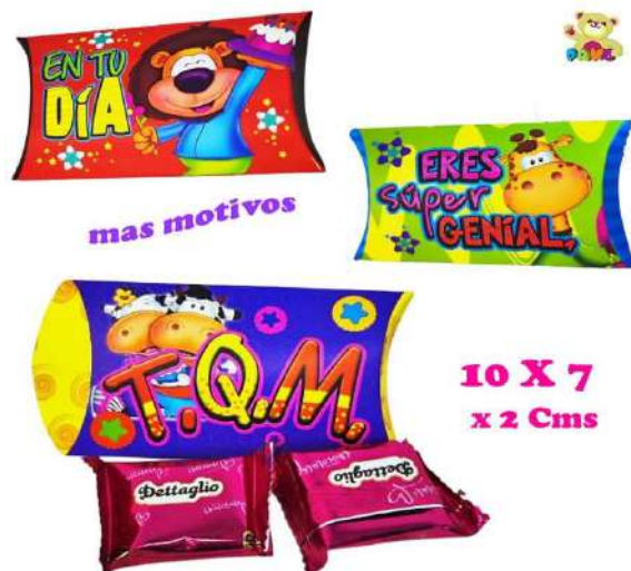
CJM CHOCOJOJIN $1.500 C.U