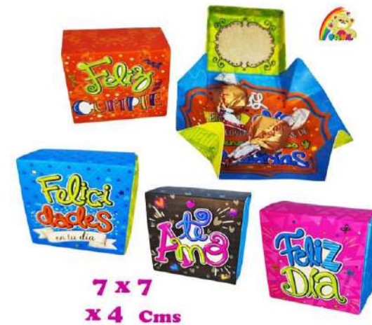
CTCP CHOCO TARJETA $3.700 UND