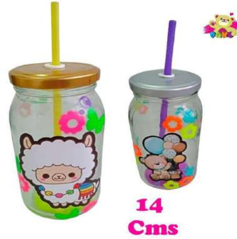
CGP CAJA DULCERA $4.100