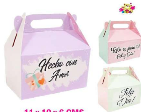
CMLO MINI LONCHERA $1.500