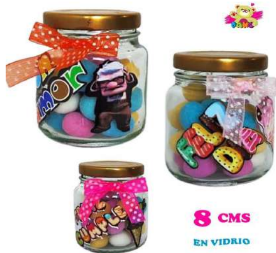
WG-018 DULCE ALMENDRA MANI $4.300