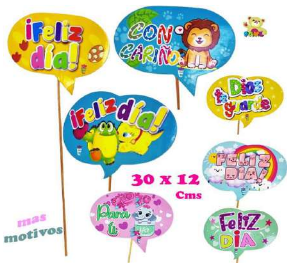
DS-PBUV PIN INFANTIL $600 C.U