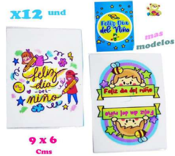
STICK-RTP STICKERS INFANTIL $6.000