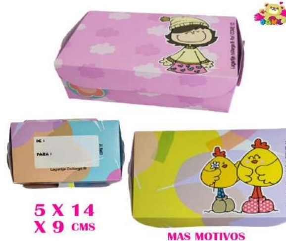
CDME EMPAQUE SIN TEXTO $2.200