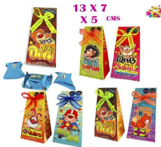
CME CHOCO MELI $4.700