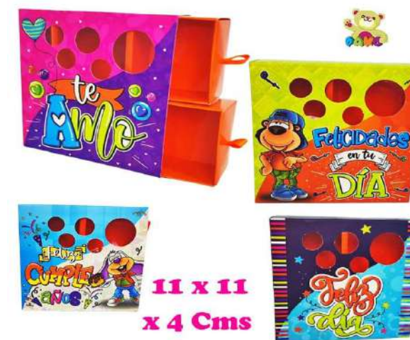
GBP CAJA DULCERA CAJÓN $3.200