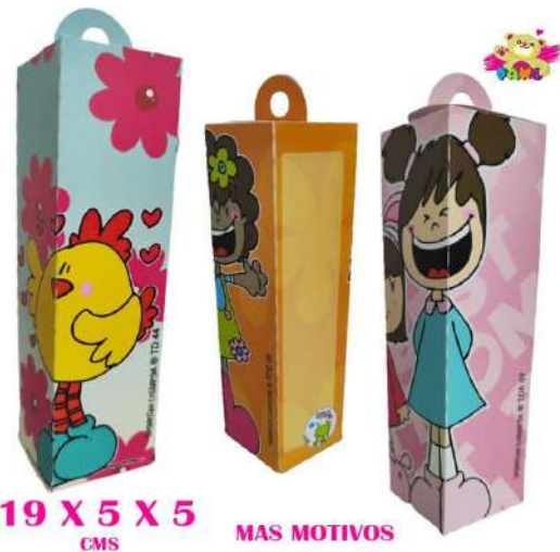
TDE CAJA TORRE DULCERA $2.000 SIN TEXTO